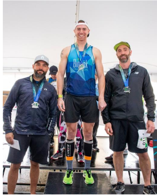
5 KM Homme