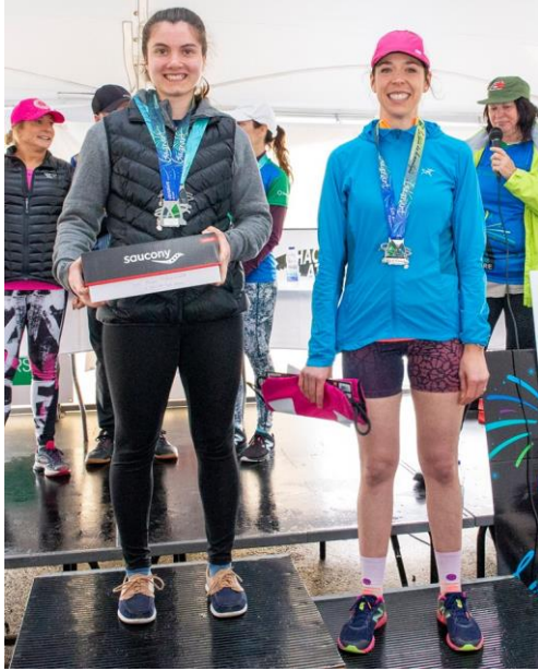
5 KM Femme